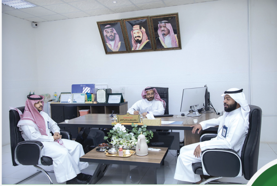
زيارة ممثلي اللجنة الوطنية لرعاية السجناء والمفرج عنهم وأسرهم ( تراحم ) بمنطقة نجران