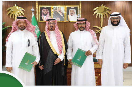
شراكة مجتمعية مع رئيس ميدان سباق الهجن بشرورة