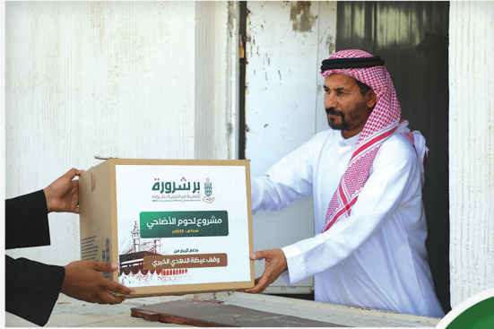
مشروع لحوم الأضاحي