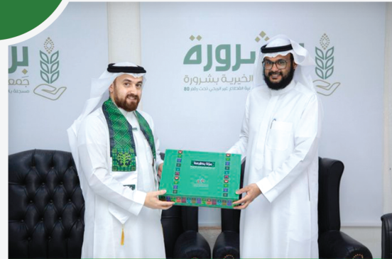
مدير جمعية تعزيز القدرات الشبابية بمحافظة شرورة " عزم " لمناقشة الشراكة القائمة وسبل تعزيزها