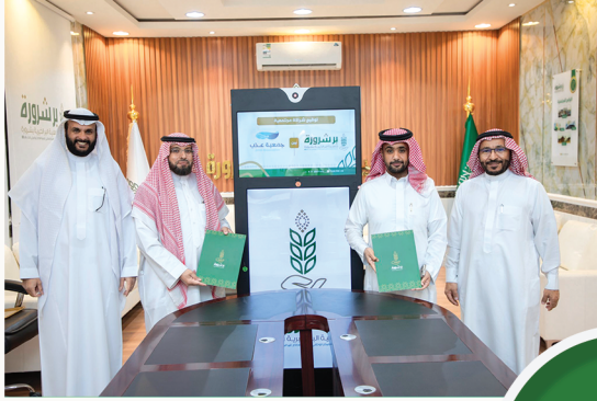
شراكة مجتمعية مع جمعية عذب لخدمات العياه بشرورة