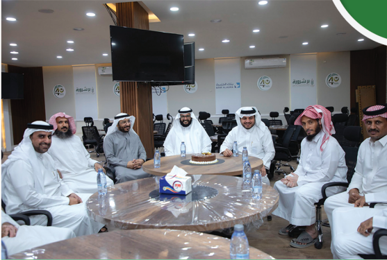
معايدة منسوبي جمعية البر شرورة بمناسبة عيد الأضحى المبارك