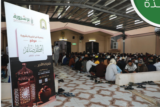
مشروع إفطار صائم