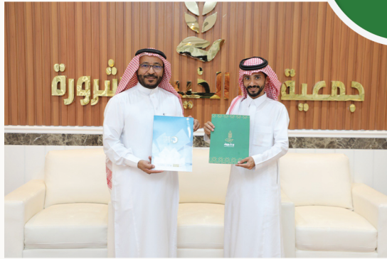
شراكة مجتمعية مع جمعية الخدمات الاجتماعية بنجران