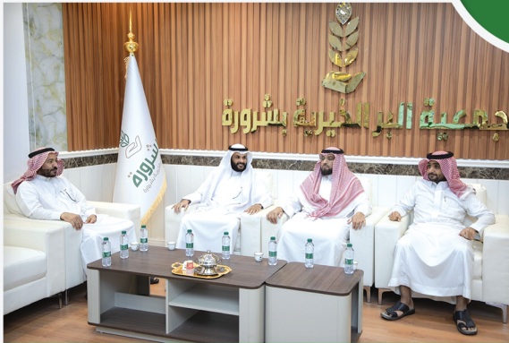
زيارة ممثلي جمعية عذب لخدمات المياه بشورة