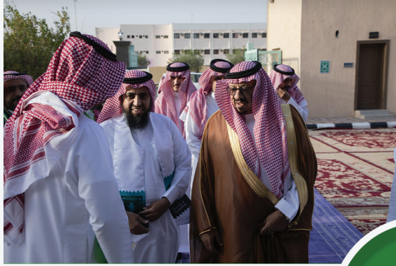
مشاركة الجمعية في احتفالية اليوم الوطني في مركز التنمية الاجتماعية بحضور محافظ شرورة