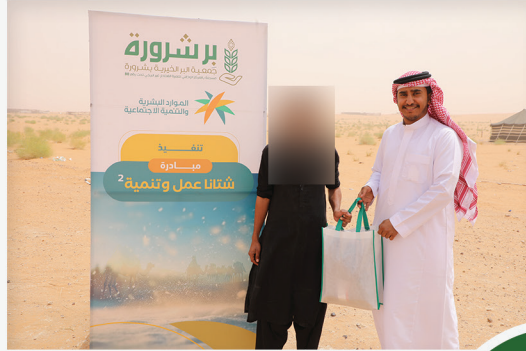
مبادرة شتانا عمل وتنمية