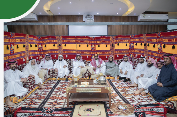
من إحتفاء موظفي #بر_شرورة بمناسبة #يوم_التأسيس