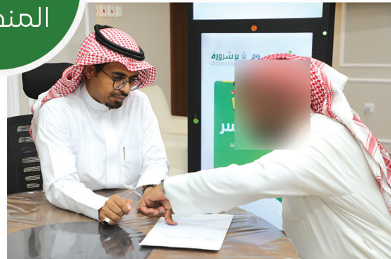
مشروع أیواء الأسر