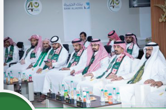
من إحتفاء منسوبي الجمعية بمناسبة اليوم الوطني