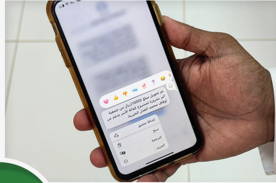
مشروع كفالة الأسر