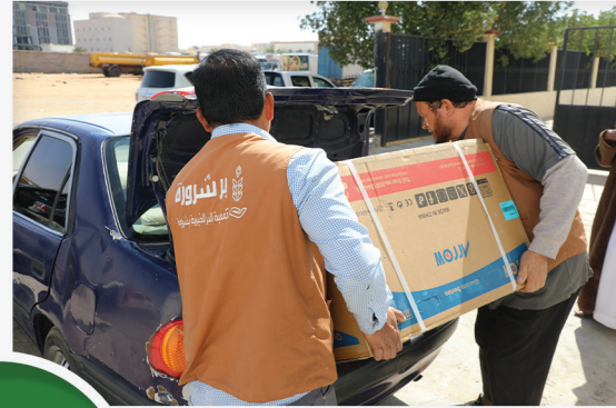
مشروع الأجهزة الكهربائية