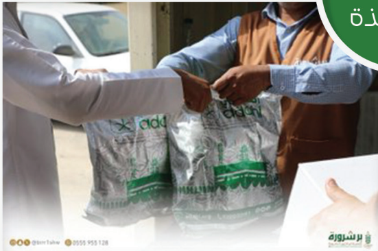
مشروع لحوم الهدى والأضاحي