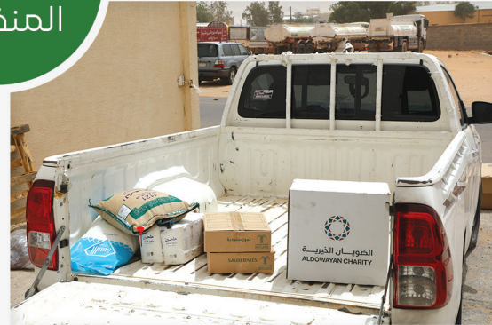
مشروع السلات الغذائية