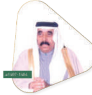
الأمير ناصر بن خالد السديري أمير شرة سابقاً