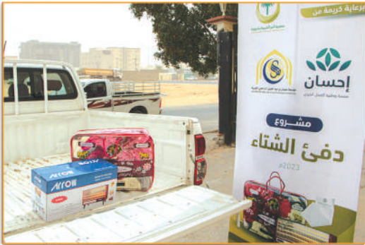
● مشروع كسوة الشتاء ●