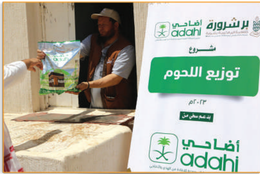
● مشروع اللحوم ●