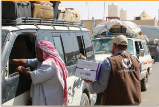
● مشروع مياه الشرب ●