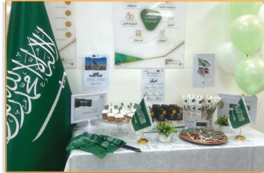
● احتفائية يوم العلم ●