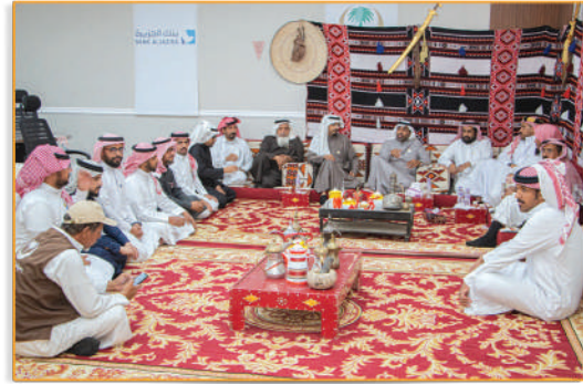
● احتفائية يوم التأسيس ●