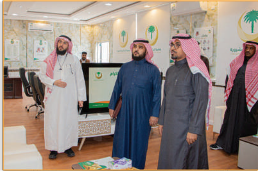
● استضافة وفد أوقاف الضويان الخيرية ●