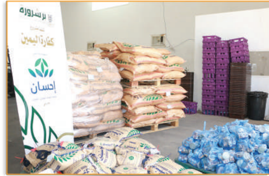
● مشروع كفارة اليمين