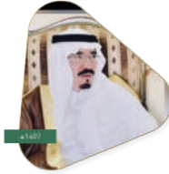
سعادة الأستاذ علي بن بريك القرني أمير شرة سابقاً