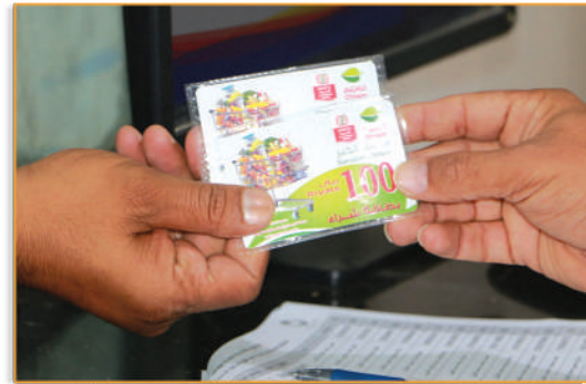
● مشروع سنابل الخير