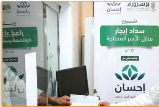
● مشروع سداد الإيجارات