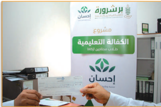
● مشروع كسوة الشتاء ●