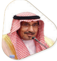
صاحب السمو الملكي الأمير مشعل بن سعود بن عبدالعزيز الرئيس الفخري للجمعية