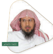
مصلحة الشيخ إبراهيم بن علي العبيدان رئيس محكمة شرة سابقاً