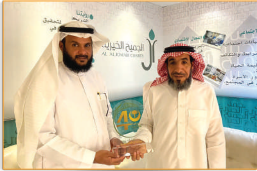
● زيارة مدير الجمعية لمؤسسة آل الجميح الخيرية ●