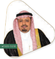
سعادة الأستاذ عبدالله بن دليم القحطاني محافظ شرة سابقاً