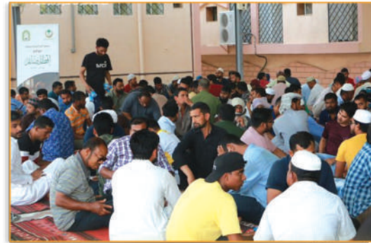
● مشروع إفطار طائم ●