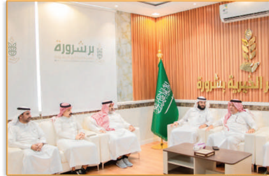
● استضافة مالك مركز تنمية المستقبل للتدريب والتأهيل ●