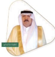
سعادة الأستاذ جاسر بن أحمد الشهري أمير شرة سابقاً