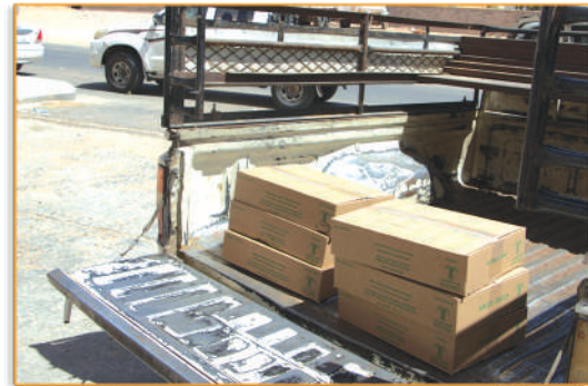
● مشروع التمور ●