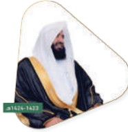
مصلحة الشيخ محمد بن حسن الحماد رئيس محكمة شرة سابقاً