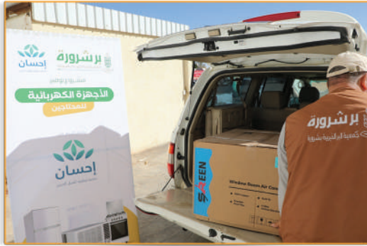
● مشروع الأجهزة الكهربائية