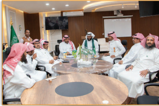
● احتفائية اليوم الوطني ●