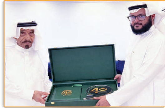
● زيارة مدير الجمعية للأمير / ناصر السديري ●