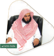
مصلحة الشيخ محمد بن عبدالله السجيم رئيس محكمة شرة سابقاً