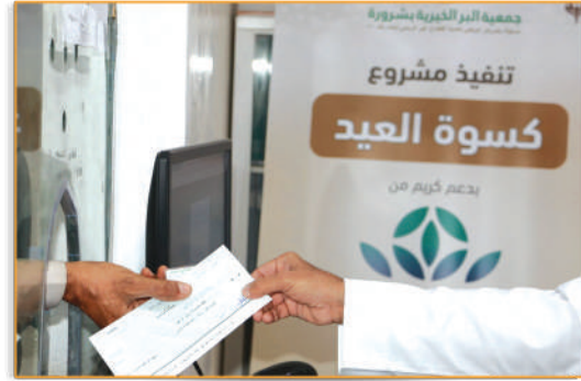
● مشروع كسوة العيد ●