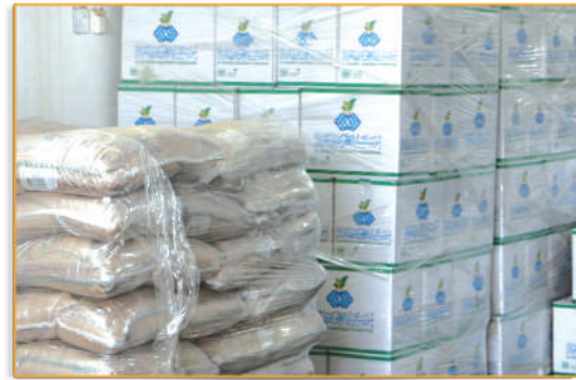
● مشروع السلات الغذائية ●