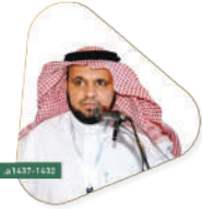
سعادة الدكتور صالح بن عبدالله الصعري مدير كتابة العلوم والآداب بشرة سابقاً