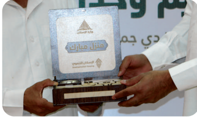
صورة تسليم الوحدة السكنية للأؤد المستفيؤين