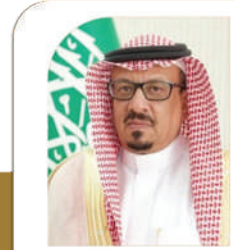
الأستاذ/ موفق بن عبد الهادي العنزي محافظ محافظة شرورة

يشكر جمعية البر الخيرية بشرورة لمشاركتها الفاعلة في اليوم الوطني 91