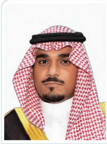
صاحب السمو الملكي الأمير تركي بن هذلول بن عبدالعزيز آل سعود نائب أمير منطقة نجران

جمعية البر الخيرية بشورة مسجلة بوزارة الولاية البشرية والتنمية الإجتماعية برقم ٨١