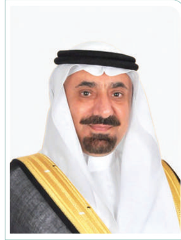
صاحب السمو الأمير جلوي بن عبدالعزيز بن مساعد آل سعود أمير منطقة نجران

وافر الشكر والتقدير لأميرنا ونائبه على وقفتكم ومساندتكم في دعم مسيرة الجمعية